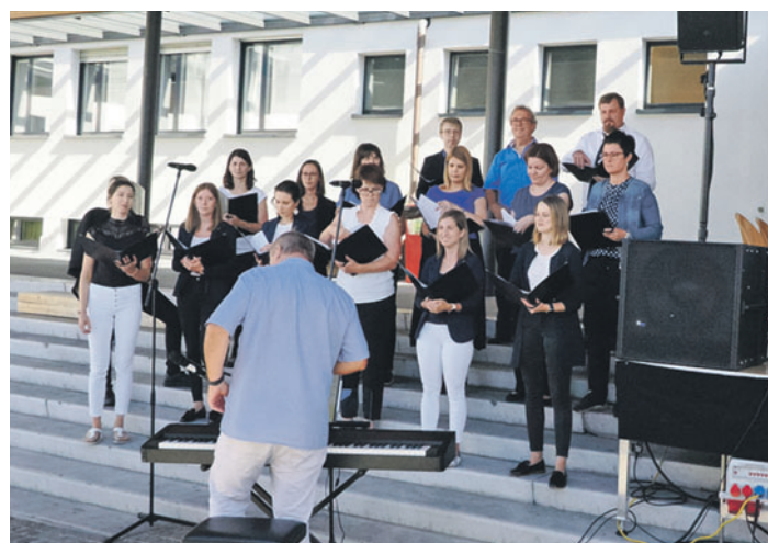
Der Chor Young Unlimited begleitete nicht nur die heilige Messe am Sonntag, sie sangen auch noch einige Lieder aus ihrem Repertoire.