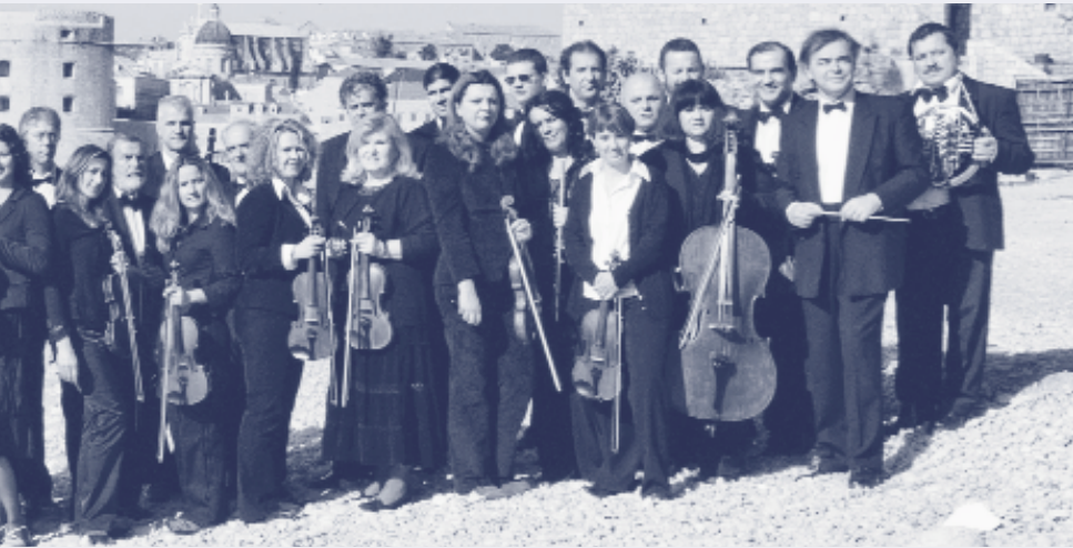
Dubrovnik Symphony Orchestra