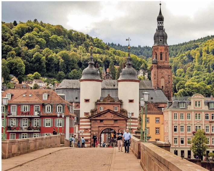
Der Besuch der Stadt Heidelberg steht ebenfalls auf dem Programm der Kultur- und Genussreise.

Das detaillierte Programm sowie weitere Auskünfte sind beim Liechtensteiner Seniorenbund, Austrasse 13, Vaduz, Tel.